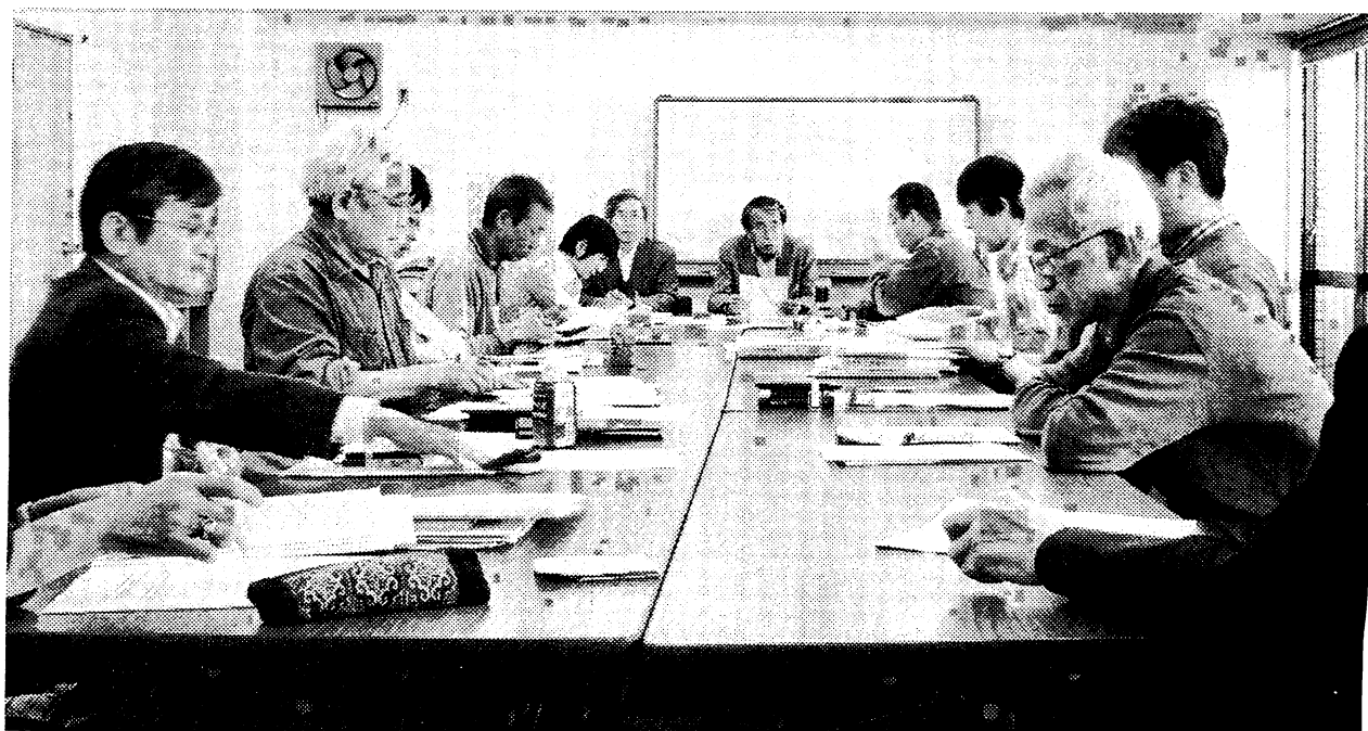
月1回の全体弁護団会議で作戦会議中