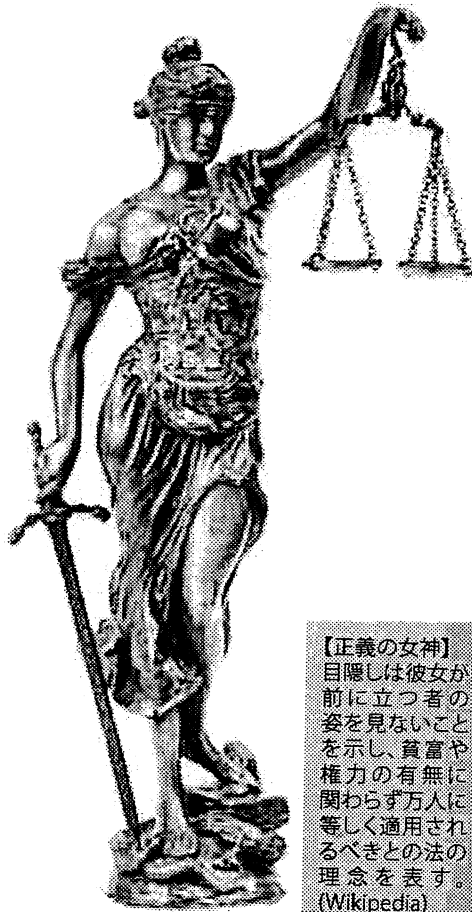
【正義の女神】 目隠しは彼女が前に立つ者の姿を見ないことを示し、貧富や権力の有無に関わらず万人に等しく適用されるべき法の理念を表す。(Wikipedia)

そういうわけで、大学卒業時には弁護士など夢想だにせず、デパートに就職しました。当時はバブルのころで、ボーナスが年3回もある会社でしたし、華やかな職場が良いなあという程度の理由でした。しかし、上司とケンカしてばかりで、2年ほどで業界新聞の記者に転職しました。この転職動機もなんとなくという感じでしたが、強いて言えば自由な職業にあこがれていました。記者は4年やりましたが、実はあまり自由に書けないジャーナリズムの実態というのを知り、嫌になりました。そういえば法学部出身だったよなあと思い、確か29歳のときに会社を辞め、バイトをしながら司法試験を受けました。こんないい加減な経緯で平成11年