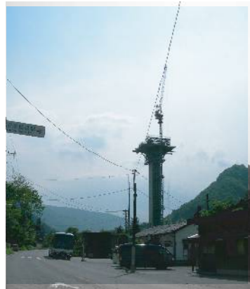
湖面1号橋(川原湯温泉駅前)

JR川原湯温泉の駅前に建設中の湖面1号橋は、橋脚が空高く伸び、橋げたが造られ始めました。