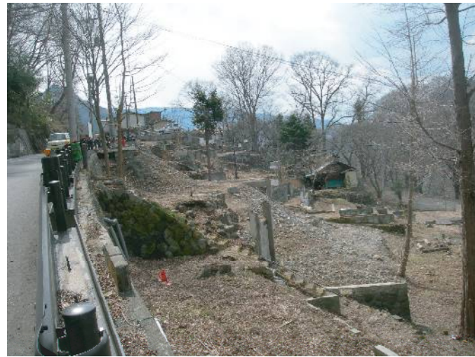
現在の川原湯温泉