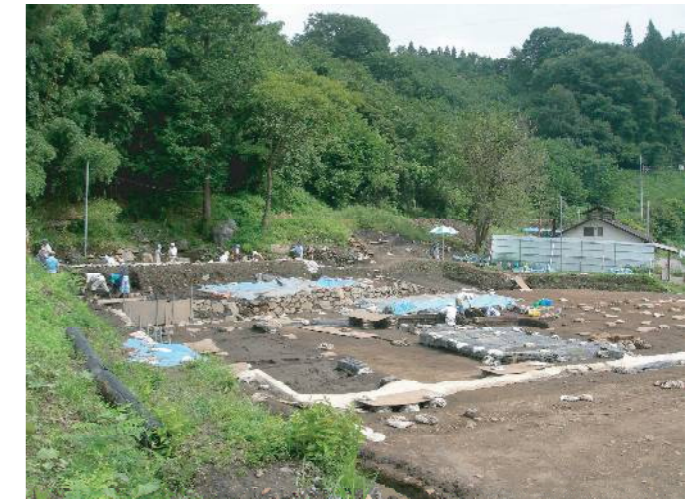
東宮遺跡発掘調査

発掘調査はダム事業費から支出されていますが、国交省はハッ場の遺跡に関心が集まることを避けたいようで、文化庁の列島展への「東宮遺跡」の展示にも難色を示しています。