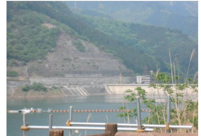
アンカーボルトで支えられたダムのり面

このダムは、地すべりで有名です。1999年にダム本体工事に着手し、2004年に完成しましたが、2005年10月の試験湛水開始から地すべりが頻発。ようやく一昨年の3月に供用開始となりましたが、地すべり対策にかかった費用が、なんとトータルで300億円。供用開始後の対策費に145億円もかかっています。国道や市道にも亀裂が入り、これまで7回の対策工事を行っています。