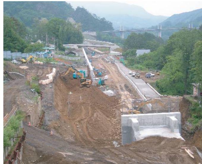
川原湯温泉移転予定地

われた可能性があり、安全性が不安視されている。代替地の用地提供に応じない地権者もいる。