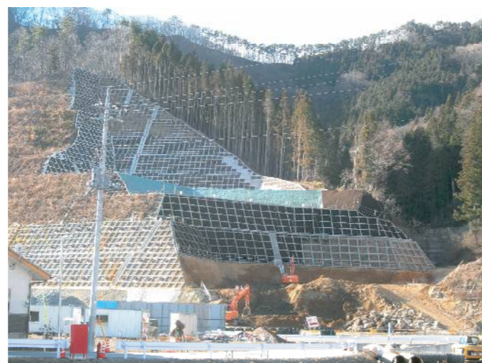
付け替え国道脇の対策工事 2011年12月20日