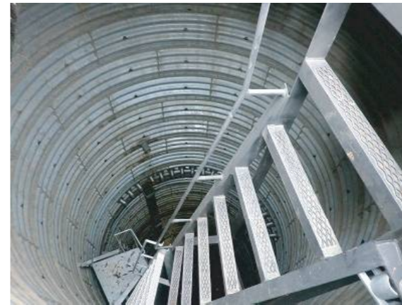
直径約3.5mの筒状井戸の中

現地では、関東地方整備局二瀬ダム管理所木村所長から説明を聞きました。このダムは、1961年完成後も貯水池周辺の地すべり対策に悩まされ続け、2年前には麻生地区に大がかりな集水井戸を2基設置しています。井戸の上に建っているかつての民宿はダムの水位が下がると家がギシギシきしみ、柱や床材が斜めに歪んでずれるなどの地割れの被害を被ってきました。