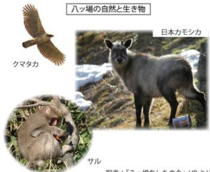
ハッ場の自然と生き物