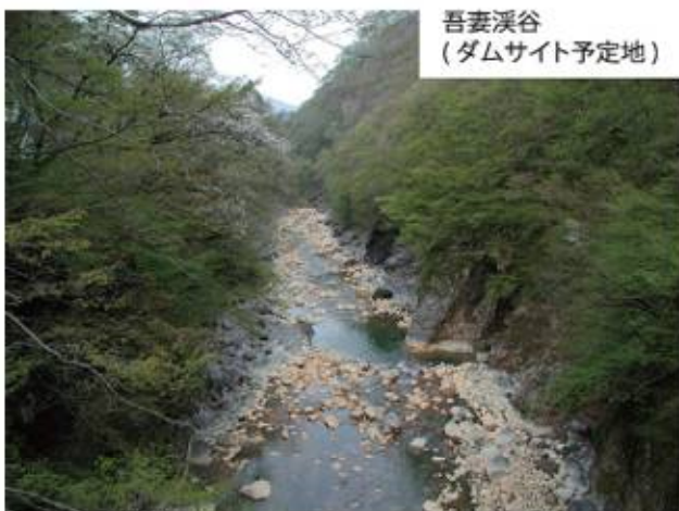
吾妻溪谷 (ダムサイト予定地)