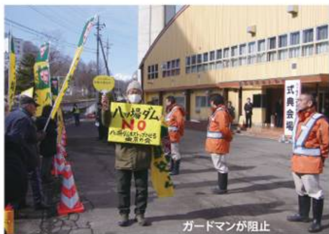
ガードマンが阻止

事業が進められているハッ場ダム工事は、本体工事が着工したことを世間に認知させるためのセレモニー（起工式）が2月7日、現地で、国や現地自治体、そして6都県知事、国会議員や地方議員、一部の住民それに工事業者が参加して行われました。千葉県は副知事ほかの参加だったとのこと。