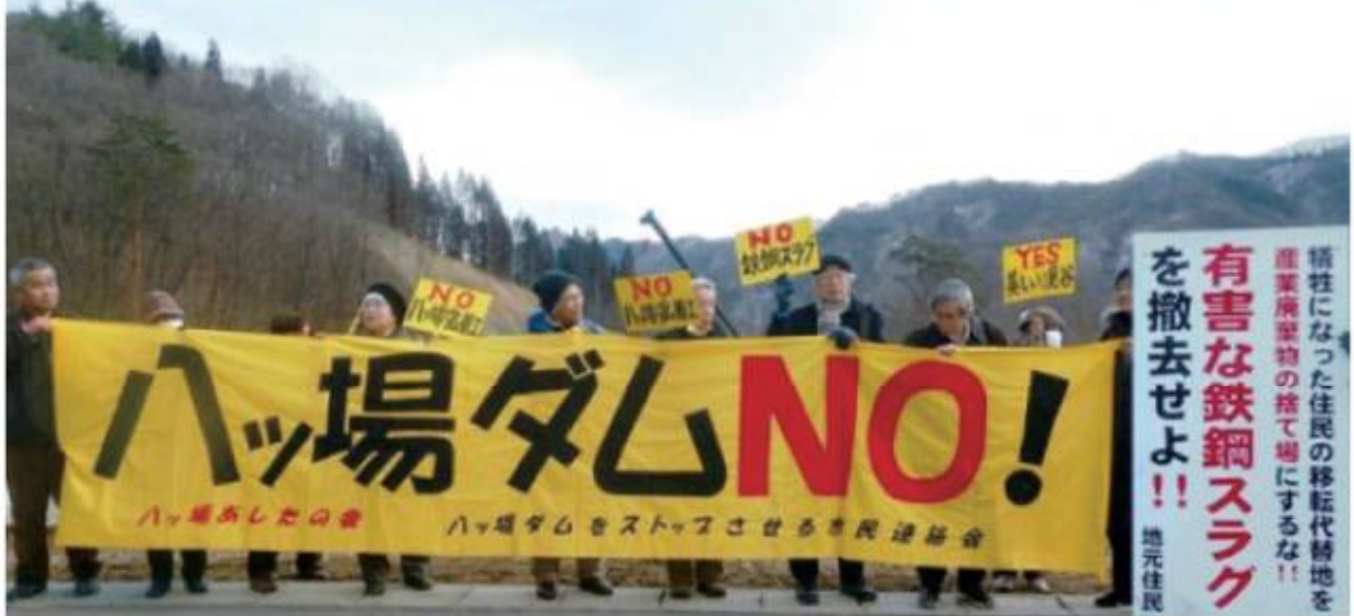
発破作業予定地の前で、シュプレヒコール