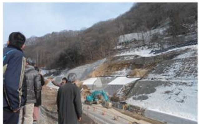
山を削って砂防ダムを造り、付け替え県道を造成中