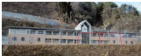
廃校になった長野原町立第一小学校

4月3日、ハッ場ダム水没地域の発掘調査の出土品を展示する「やんば天明泥流ミュージアム」がオープンしました。1783(天明3)年の浅間山大噴火で村落をのみ込んだ「天明泥流」被害の実態を伝えるための博物館となっています。展示室には、映像シアターやジオラマ、体験学習室