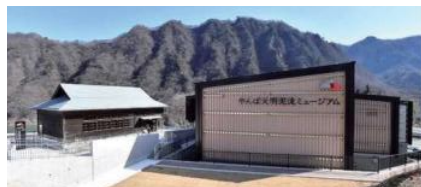
やんば天明泥流ミュージアム HPより

ダムを誘致すれば地域が潤う、町が活性化するとする無責任な国のやり方はダムも原発も同じ構図です。このような税金の使い道に反対するためにも、これからも無駄なダム建設事業にNOを突きつけていきます！